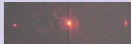
Figura 3.1. Foto da difração da luz no ar.

De modo similar obtemos a mesma representação esquemática da difração na água, havendo uma diminuição da distância entre a difração de ordem zero e a difração de 1ª ordem, indicando uma dimi-