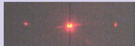
Figura 3.2. Foto da difração da luz na água.