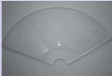
Figura 1. Pedaço de CD cortado sem a proteção metálica.

de papel, que servirá de anteparo, com uma risca no centro e na posição vertical. Posicione o pedaço de CD, que servirá como rede de difração, de modo que quando incidir a luz laser a difração de ordem zero irá coincidir com a risca do papel e as demais ordens fiquem na posição horizontal. Ambos, o papel e o CD, têm que ser posicionados na parte externa do frasco e em extremidades opostas. Coloque