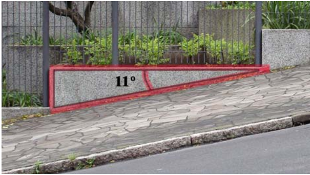
Figura 2. Nas edificações no entorno da rua encontramos indicadores da vertical e/ou horizontal.

via e constatamos que os automóveis que por ali trafegavam costumavam patinar as rodas de tração.