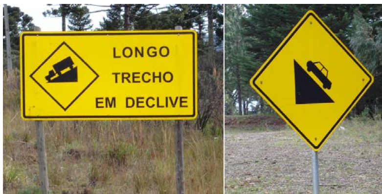
Figura 1. Placas sinalizando os declives acentuados em rodovias.

As inclinações máximas de ruas e estradas são bem menores do que aquelas imaginadas pela grande maioria dos nossos alunos. Inclinações em relação à horizontal superiores a 5° excepcionalmente são encontradas em rodovias. Ruas com inclinações próximas de 15° costumam ser raras e normalmente estão interditas para a subida de caminhões. O limite teórico para a inclinação da rampa que um automóvel com tração em duas rodas pode galgar situa-se abaixo de 30° com pista seca e abaixo de 20° com pista molhada.