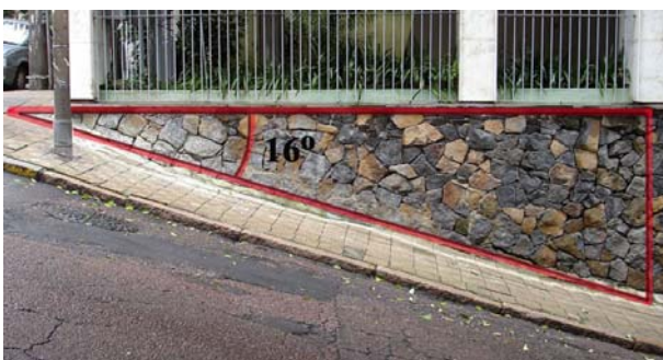
Figura 3. Rua muito inclinada no centro de Porto Alegre, interdita para a subida de caminhões.

Em uma rampa inclinada por 10^\circ , sobe-se cerca de 18 m para cada 100 m de deslocamento horizontal. Para ângulos pequenos sabe-se que a tangente e o seno do ângulo são aproximadamente iguais. Portanto também podemos interpretar esta declividade de 18% como subindo 18 m em cada 100 m de deslocamento sobre a