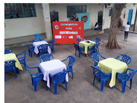
Figura 3 - Ambiente organizado para roda de leitura.

O ambiente para leitura foi organizado utilizando-se mesas de plástico com cadeiras, toalhas para forrar as mesas, mural informativo, tabela periódica à disposição e o próprio pátio, para os alunos que preferissem uma leitura mais reservada, sentados sobre a calçada. Buscou-se um ambiente modificado para maior conforto e liberdade estudantil, diferindo do âmbito de sala de aula, como mostra a Fig. 3.