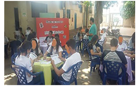
Figura 4 - Aplicação do jogo Mestre Nuclear, para as turmas do 9º ano.

O ambiente do jogo não foi a sala de aula; ele foi adequado para maior