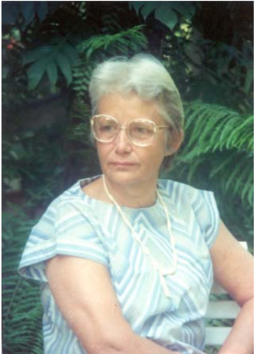
Johanna Döbereiner (1922-2000)