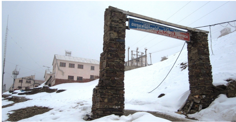
Figura 1: Laboratorio de Chacaltaya, La Paz, Bolivia.

La física de partículas tuvo sus inicios durante la primera mitad del siglo XX en experimentos de rayos cósmicos 1) , localizados al nivel del mar y a grandes altitudes, como es el caso de Chacaltaya ( \sim 5200 metros sobre el nivel del mar) como muestra la foto debajo. En 1947 fue descubierto el pión ( \pi ) en lo que es hoy el Laboratorio de Física de Rayos Cósmicos de Chacaltaya por C. Powell, G. Occhialini y C. Lattes.